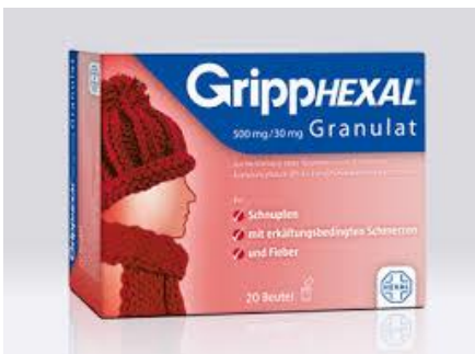
Gripphexal® 10 Beutel 5,99€ (statt 7,49€ UVP*)

Kommen Sie gut durch die Erkältungszeit!