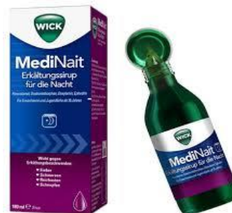
Wick®Medinait 90ml 9,99€ (statt 12,48€ UVP*)