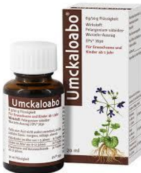
Umckaloabo® 20ml 7,99€ (statt 10,20€ UVP*)