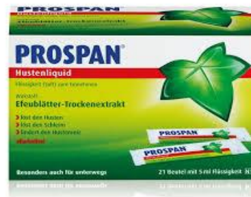
Prospan® Hustenliquid 30x5ml 7,99€ (statt 10,40€ UVP*)