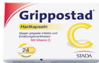
Grippostad C® 24 Kapseln 8,99€ (statt 12,48€ UVP*)