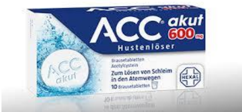
ACC® akut 600 10 Brausetbl. 4,99€ (statt 7,69€ UVP*)